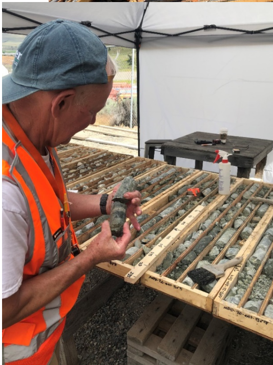
Phase-II-Bohrungen im Projekt MPD – August 2020